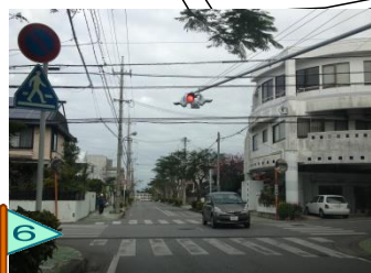
点滅信号付近、事故が多い。 停止しない車もある。危険。