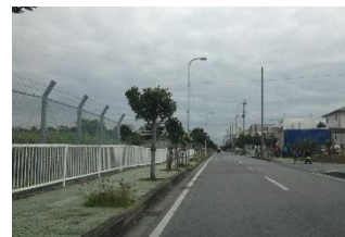
上勢頭地区は米軍基地が 広がっている。