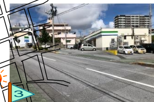
車の往来が激しく、横 断歩道や信号機がない