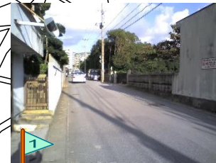
駐車が多い。飛び出し注意