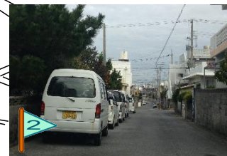
道幅が狭い。 路上駐車が多い。