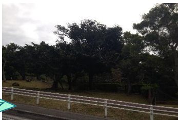
桑江公園内を横切らない。見え にくい場所で危険。池もあり。