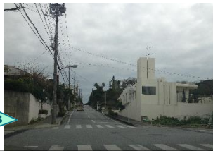
下り坂。 交差点に信号機なし。