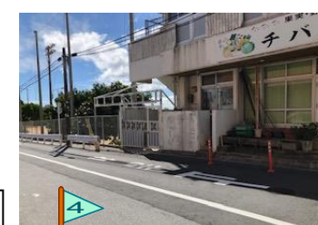
ガードレールが とぎれている