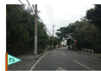
交通量が多い。抜け道あり